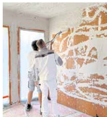
Das Baugewerbe kommt langsam aus den roten Zahlen - die Lage stabilisiert sich und könnte auch den Ausbaugewerken Auftrieb geben.

zurück. Zwar vermeldeten 21 Prozent der Befragten einen Zuwachs, gleichzeitig mussten 15 Prozent mit weniger Personal auskommen. Nach ersten Schätzungen waren Ende September rund 310.500 Menschen im oberbayerischen Handwerk tätig. Binnen Jahresfrist ist das ein Rückgang von 1,3 Prozent. Die Zahl der Handwerksbetriebe in Oberbayern stieg bis zum 30.9. auf 81.186. Das ist ein Prozent mehr als zum gleichen Zeitpunkt des Vorjahres. Für die kommenden Monate zeigen sich die Betriebe etwas optimistischer als zuletzt: 86 Prozent erwarten eine bessere oder zumindest gleichbleibende Geschäftslage. Das sind 11 Punkte mehr als vor einem Jahr. Der vorsichtige Optimismus zieht sich - mit Ausnahme des Handwerks für den privaten Bedarf - durch alle Branchen.